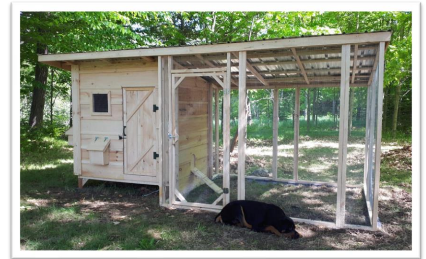
Exemple de poulailler urbain avec volière attenante