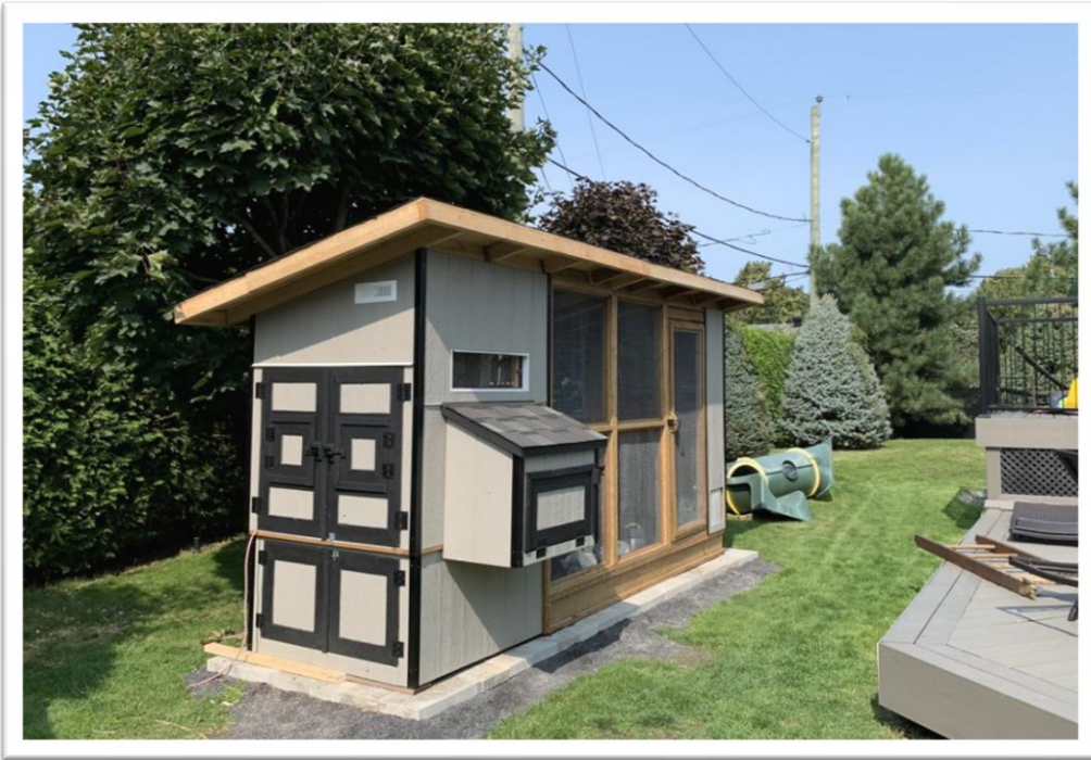
Exemple de poulailler urbain avec volière attenante

« Poulailler urbain » : Bâtiment accessoire et complémentaire à l'usage principal d'habitation, servant exclusivement à la garde de poules et muni d'une volière attenante.