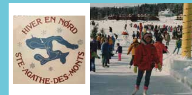
Fin années 1980 - Baie J.-Albert-Cloutier L'Hiver en Nord (1982-2007) devient l'incontournable festival pendant 25 ans.